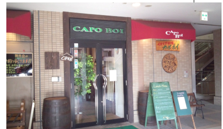
「カポ・ボイ外観」 F ココカラファイン (薬局) ・ 2F 早稲田塾の、 右手のエレベータで3Fへどうぞ