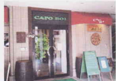
「カポ・ボイ外観」 1F ココカラファイン (薬局) or 2F 早稲田塾の、 右手のエレベータで3Fへどうぞ